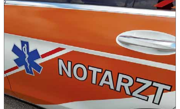
Der Meraner Notarzt konnte nichts mehr für den 82-jährigen Seniorbauern vom Kerscherhof in Aschl tun.