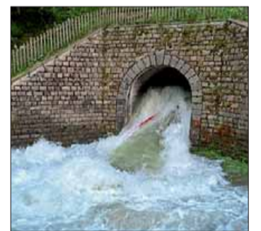
Auch gestern ein unverändertes Bild beim Zogler Stausee in Ulten. Benjamin Mair

Laut einer Aussendung von Alperia, die die Anlage betreibt, handelt es sich bei der „erhöhten Wasserabgabe aus dem Grundablassstollen um einen technischen Defekt an einer seiner Komponenten“. Die Lage werde seitens Alperia kontinuierlich überwacht und es werde an der Behebung des Defekts gearbeitet, heißt es in der Aussendung. Die Wassermenge aus dem Tunnel sei stabil und unter Kontrolle, ebenso wie die Wasserführung der Falschauer. Die Staumauer des Zogler Stausees sei von dem Problem nicht betroffen, unter-