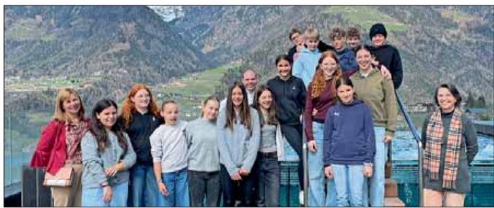
Die Jugendlichen bei der Hotelbesichtigung im Hotel „Hohenwart“. HGJ

BERUFSBERATUNG: HGJ und lvh in der Mittelschule